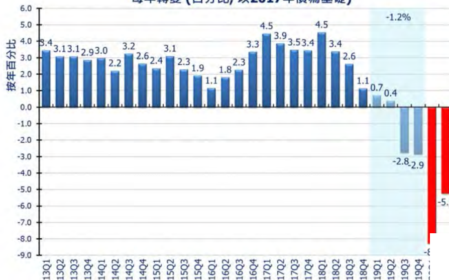
每年轉變 (百分比, 以2017年價為基礎)